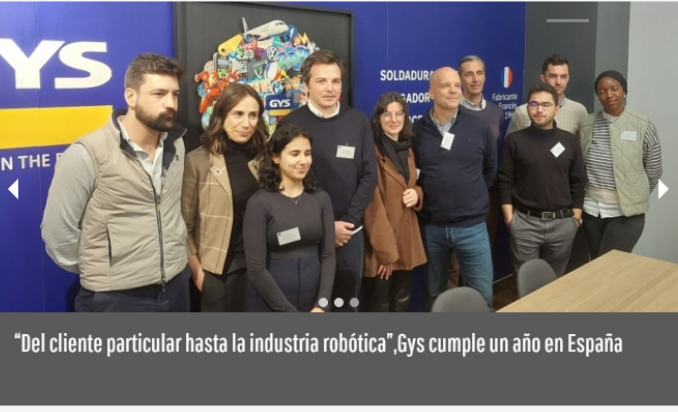
"Del cliente particular hasta la industria robótica", Gys cumple un año en España